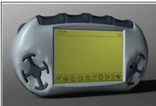
Abb 3: Sieht nicht aus wie ein Ei, heisst aber so: Das DataEgg

„The egg finally makes it possible to use a Personal Computer with one hand instead of three ” - G. Friedman